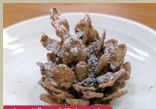
まつほっくりケーキ