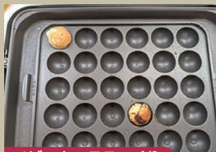
ベビークラスター作り